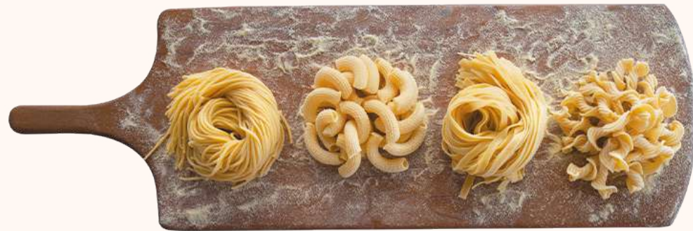
Spaghetti • Maccherone • Fettuccine • Garganello