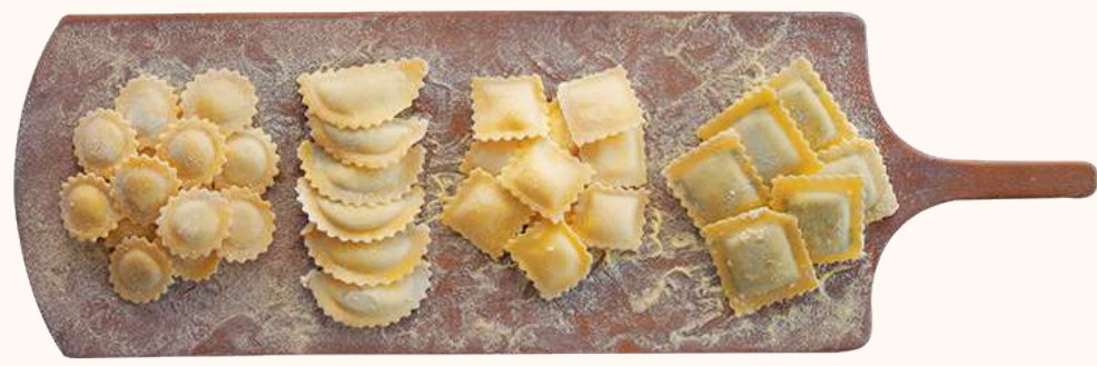
• Ravioli Rellenos: carne, pollo, queso ricotta, espinaca y tres quesos